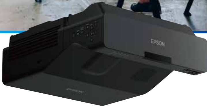
雷射超短焦投影機 Multimedia Projector EB-755F